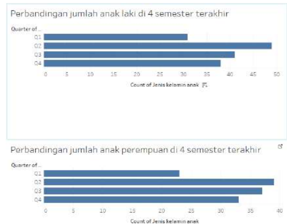
Gambar 5. Grafik perbandingan jumlah kelahiran berdasarkan jenis kelamin per semester

Public . Grafik perbandingan jumlah kelahiran anak berdasarkan jenis kelaminnya dapat dilihat pada gambar 5 berikut.