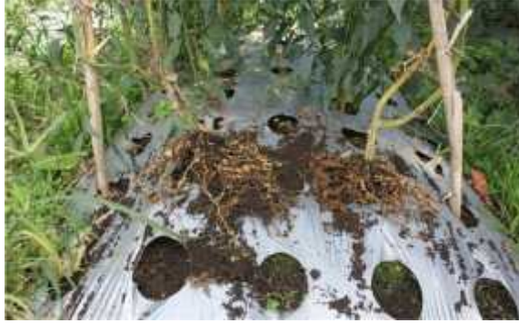
b. Lokasi demplot