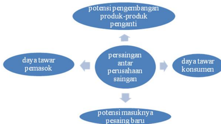
Gambar 3. Model Lima Kekuatan dari kompetisi David (2012:146)